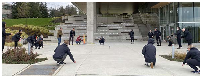
Module pour entraîneurs d'athlètes autochtones, Victoria