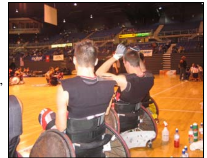
La "veste de glace" conçue pour les athlètes en fauteuil roulant fut utilisée par les Canadiens lors des Championnats du monde de rugby en fauteuil roulant.

Après une phase de développement de plusieurs mois, les « vestes de glace » furent largement utilisées aux championnats du monde de rugby en fauteuil roulant de 2006. Les Jeux de Beijing approchent à grands pas, et les athlètes et leurs entraîneurs doivent systématiquement tester et mettre en œuvre de nouvelles technologies qui pourraient améliorer la performance des athlètes aux Olympiques.