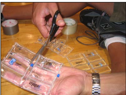
Un sac gelable Cryopak ® est taillé sur mesure pour ensuite être inséré dans une veste destinée à un athlète en fauteuil roulant.

« Les 'vestes de glace' développées par PacificSport nous ont procuré un avantage énorme aux Mondiaux. Elles nous ont refroidis, et les autres équipes n'avaient aucune idée de ce que nous faisons. Je crois leur avoir dit que nous portions des gilets pare-balles! C'est formidable de savoir que nos chercheurs dans le domaine du sport développent des produits de pointe qui nous aident à avoir un avantage sur les autres compétiteurs. »